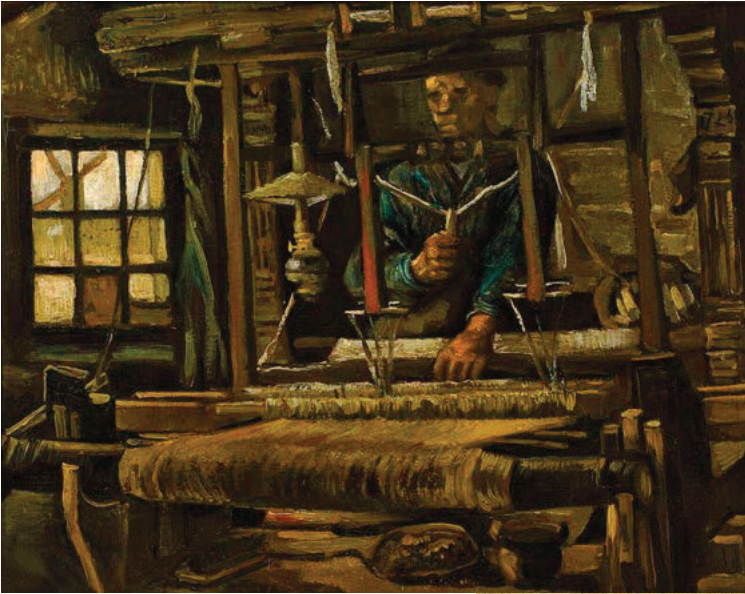
Weefgetouw met wever (1884)