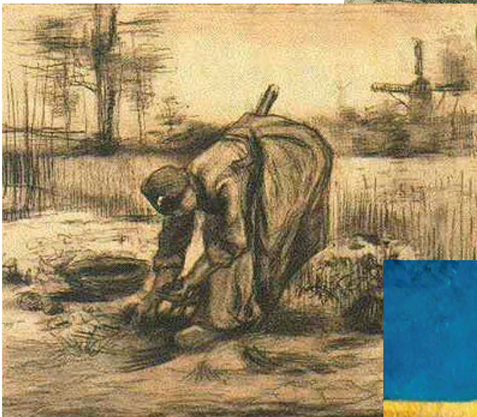
Een boerin die aardappels root (zomer 1885)