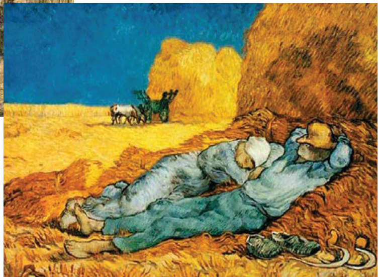
“Middag , rust na arbeid, Siësta” (1889)