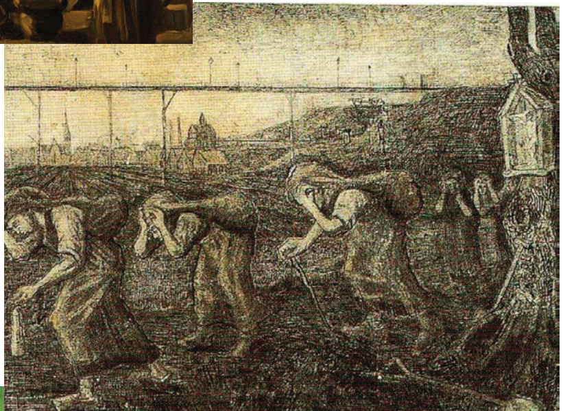
Alledaagse scènes uit het leven van de mijnwerkers (1881)