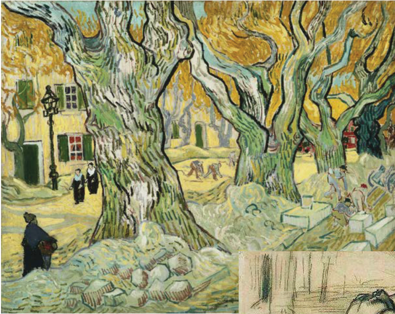
Een stel gekromde stratenmakers in de hoofdstraat van Saint-Rémy (1889)